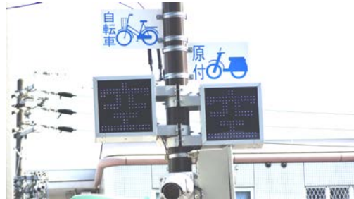
「空」表示はあったが、1カ所しか空いておらず探すのに苦労。