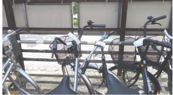
早朝などに置かれた車には清算するよう勧告