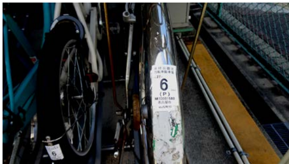
定期駐車用のシール