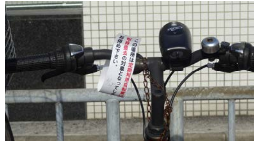
定期置き場に止めた1回利用には警告