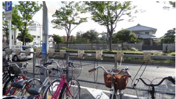
駅からはなれるとガラガラ