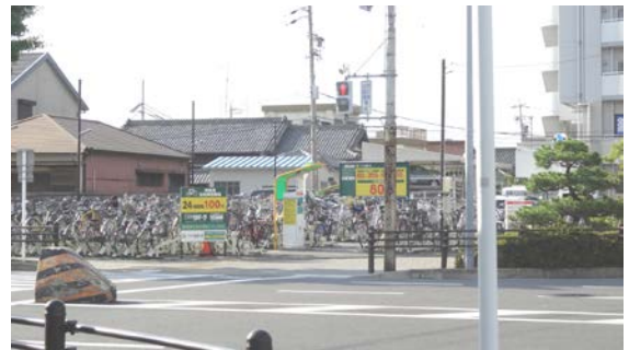
交差点の筋向いには三井のリパーク