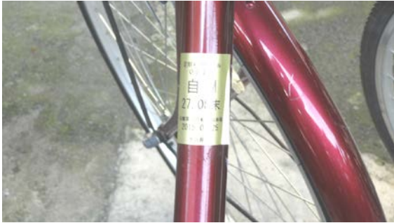
定期利用にはシールを