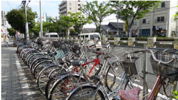
ワイヤー式の市営路上駐車場。