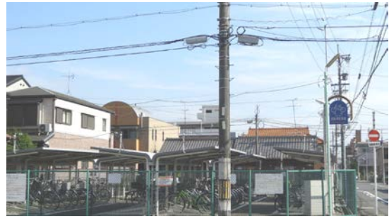
遠い南駐車場(定期専用)はがらがら