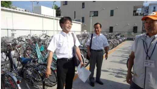
管理人の説明を聞く