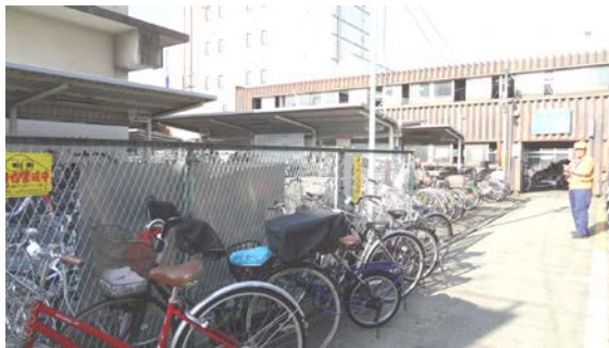
置き場がないので通路にも止めている