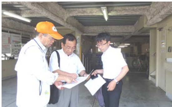
管理人がいる東駐車場で話を聞く。定期の新規申し込みは別の管理事務所でやっているため巡回する余裕がある。場内案内看板はすべて定期置き場になっているが、利用規定は1回利用がある。