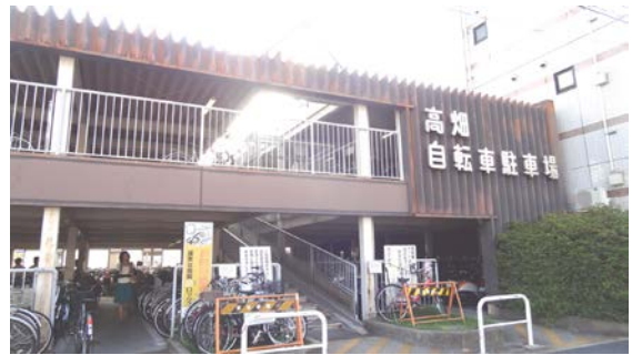
出入り口はいっぱいあり、2 階駐車場も