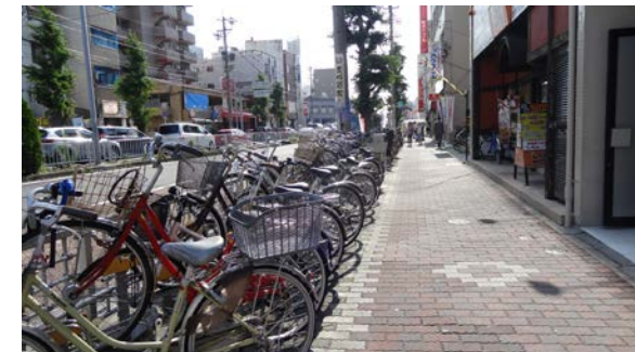
許可駐車場は1回利用専用