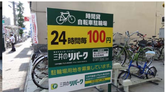
隣の空地には同じ料金とシステムの民間駐車場