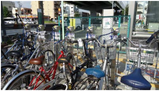
ワイヤー式もロック式と同じく集中清算方式。