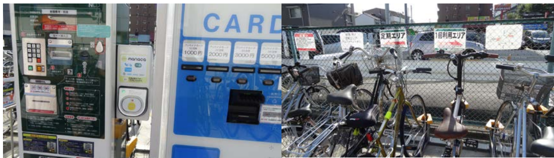
機械は最新式のマナカ対応。カードもOK 定期エリア(左)と1回エリア(右) 定期の最初の申し込みは別の管理事務所で。