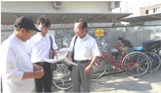
広い駐車場に管理人が4~5人おり、チーフと懇談。