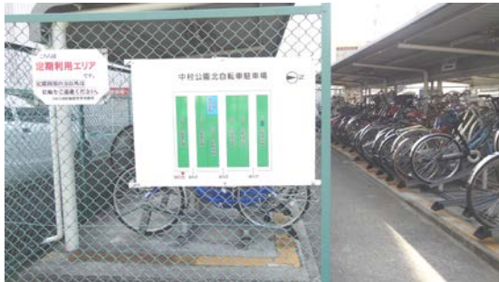
駅に近い北駐車場(定期専用)は満車